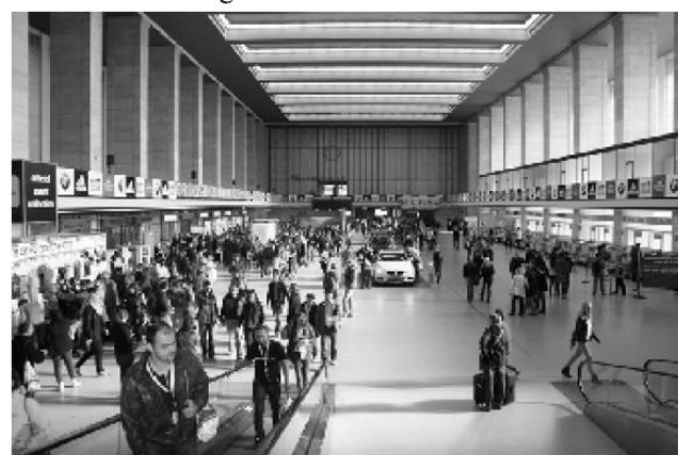
Der Weg zur Startnummer: Abflughalle des außer Betrieb befindlichen Flughafens Tempelhof

Weiter durch die Hallen wird immer wieder der Blick nach draußen auf das riesige ehemalige Rollfeld frei. Man meint, die Fluggeräusche der „Rosinenbomber“ müssten bald ertönen, die in schlimmen Zeiten auch Süßigkeiten von Bord abwarfen, um den West-Berliner Kindern wenigstens ein wenig Freude und Hoffnung auf bessere Zeiten zu geben.