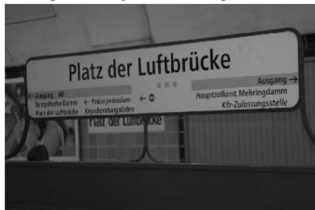
Symbol vergangener Zeiten: U-Bahn-Station „Platz der Luftbrücke“

unterwegs ist, für den ist die Berliner Veranstaltung mit seiner eigenen Atmosphäre trotzdem angenehme Pflicht.