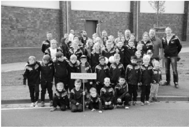
40 Kinder mit einigen Jugendtrainern vor dem Festzug

war phänomenal, denn sehr viele Bürger und Bürgerinnen der Stadt standen am Zugweg und applaudierten.