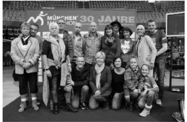
Bleißfuß goes Olympia: Die TuS Mannschaft im Münchener Olympiapark