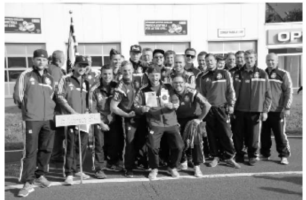
TuS-Senioren vor dem Festzug

der Feytalstraße um sich für den um 11 Uhr beginnenden Festzug aufzustellen.