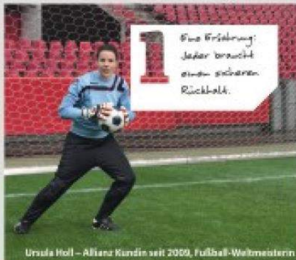
Ursula Holl – Allianz Kundin seit 2009, Fußball-Weltmeisterin

Im Schmidtenloch 34, 53894 Mechernich Telefon 02443/911978 www.ra-totter.de