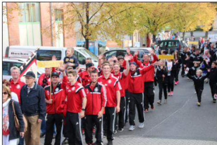
40 Jahre Stadt Mechernich mit Abordnung der TuS