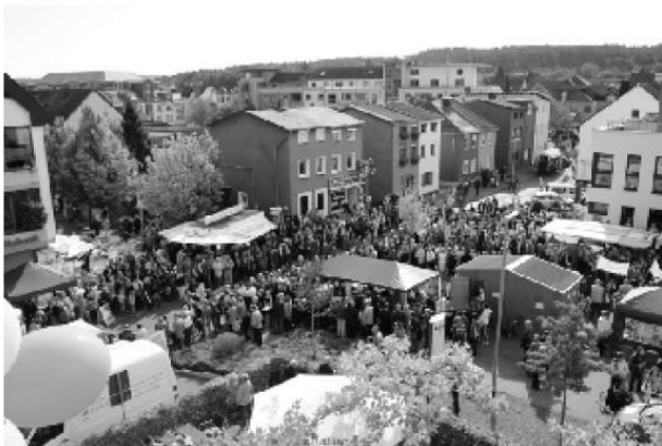
Die Stadt ist voller Menschen - Tolle Atmosphäre

Nach dem Einmarsch aller Zugteilnehmer begann das bunte Treiben im Stadtkern. Die Jugendabteilung hatte sich von den Junggesellen Harzheim (nochmals ein großes DANKESCHÖN) einen Lebendkicker geliehen, welcher rund um die Uhr zu „Kicken“ genutzt wurde. Hier stand der Spaß und nicht der sportliche Wettstreit im Vordergrund und man munkelt, dass selbst unser Bürgermeister nebst geladenen Gästen ein paar Kabinettstückchen auf den Asphalt zauberte. ☺