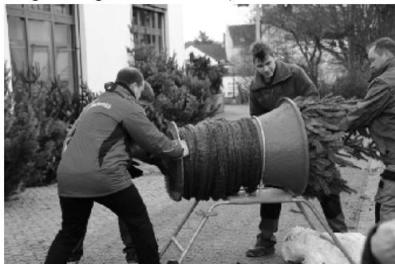
Seit Jahren wird mit vereinten Kräften angepackt - Tradition verpflichtet!

An dieser Stelle weisen wir gerne schon auf unseren alljährlich stattfindenden Weihnachtsbaumverkauf hin. Dieser wird am 19.12. in der Zeit von 10:00 bis 17:00 Uhr an der Volksbank Mechernich zum nunmehr 18. Mal in Folge stattfinden. Die Bäume kosten in diesem Jahr pauschal 30 € pro Stück bei einer Größe bis 1,80 Meter und 38 € für größere Exemplare. (Das Angebot gilt solange der Vorrat reicht).