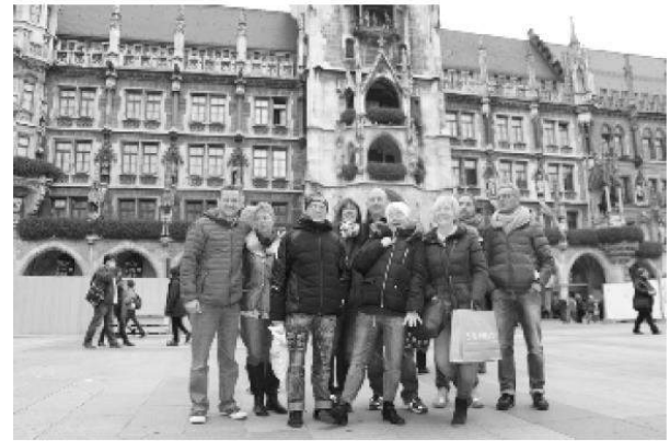
@Ralf: So sieht es aus, das Rathaus am Marienplatz in München