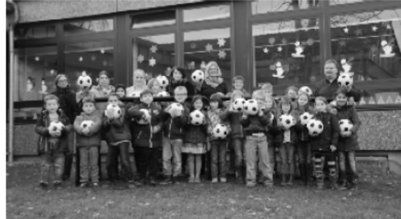
Offizielle Übergabe der Bälle und Tore an die OGS

ferien schon selbst in die Tasche griff und sechs einfache Bälle stiftete, als er sah wie Jungs mit einem platten und völlig verbeulten Ball kickten. Mit so einer Kooperation will die TuS zeigen, dass uns das Wohl aller Kinder, auch wenn sie sich keinem Sportverein anschließen, am Herzen liegt. Auch wenn es nur eine Kleinigkeit ist, so hilft sie doch vielleicht ein paar Jahre weiter.