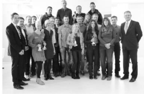
Gruppenbild mit Landrat: Siegerehrung bei der Abschlussveranstaltung im Eifelcup im Lago-Beach Zülpich

Der Lohn für Leistung und Ausdauer im Eifelcup wird alljährlich im November ausgezahlt. Die Organisatoren haben im Jahr 2015 zur Siegerehrung ins Lago Beach in Zülpich eingeladen. Und viele sind der Einladung gefolgt.