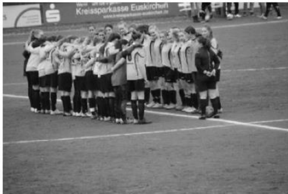
Aachen (links) gewann verdient im Eifelstadion →

Besondere Spiele - erfordern besondere Herangehensweisen. So wurde das Meisterschaftsspiel gegen den Tabellenführer aus der Kaiserstadt im Vorfeld als das Duell der "Landeier" gegen die "Großstadtkinder" angepriesen. Dies lockte letztlich knapp 50 Zuschauer an, die ein ungleiches Duell über 80 Minuten sehen sollten.