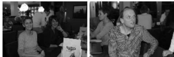
Fast alle kamen: Jahresabschlussveranstaltung des TuS-Bleifuß-Mechernich im Rathaus-Café

Doch alle Bleifuße blieben an diesem Abend von Unfällen verschont. Die Verspätungen nahm man da gerne in Kauf.