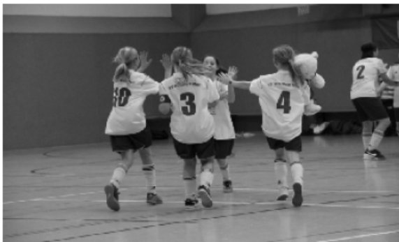
Sie feierten am Ende - Turniersieger Rot-Weiß Merl

Merl die im ganzen Turnierverlauf den besten Fußball spielten und verdient neuer Champion bei den D-Juniorinnen wurden.