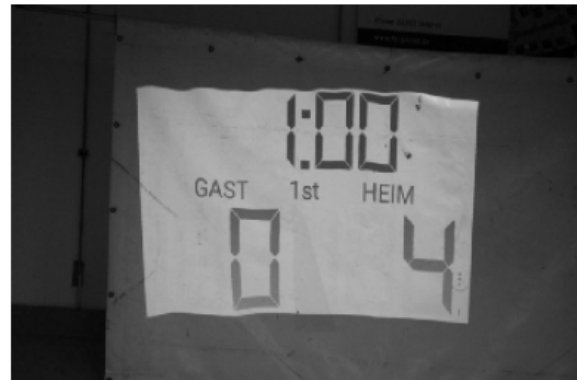
Die Technik von heute - Mobile Anzeigetafel in der DFH

SG Bürvenich/Schwerfen/Sinzenich mit sechs Punkten durch. Unser 2003er Jahrgang fand erst im letzten, bedeutungslosen Turnierspiel so richtig hinein und musste folglich mit „nur“ vier Punkten das Turnier früh verlassen.