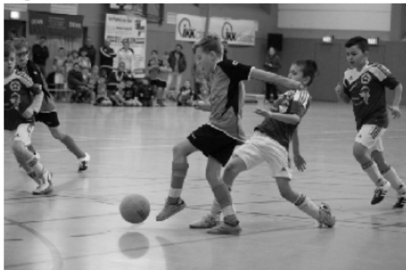
Euskirchen nicht nur im Finale immer einen Schritt schneller

doch fielen die Tore erst zwischen Minute sechs und neun. Euskirchen spielte die meiste Zeit auf das gegnerische Tor, biss sich aber am Golbacher Schlussmann die Zähne aus. Mit der nötigen Ruhe und Cleverness konnte man aber letztlich einnetzen und wurde verdient Turniersieger.