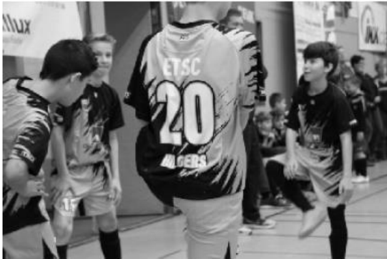
Pause? Nicht beim ETSC - Warmhalten war angesagt

beachtlicher zweiter Platz und die Erkenntnis, den Kreisstädtern zumindest in der Vorrunde als einziges Team ein 0:0 abgerungen zu haben.