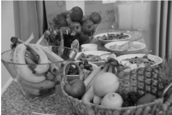
Der Renner in der Cafeteria - Frischer Obstsalat

Die große Cafeteria, welche ausschließlich durch die Eltern der Klasse 3c der KGS Mechernich betrieben wurde, erfreute sich ebenfalls großer Beliebtheit. Dass dann noch 360 Euro als Reingewinn für Grundschule übrig geblieben sind, erfreut uns natürlich sehr. Mit dieser Einnahme soll das anstehende Zirkusprojekt mitfinanziert werden.