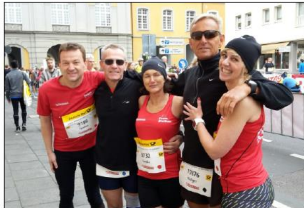
Der Bleifuß-Eifel-Express in Bonn