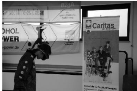
Gar nicht so einfach - Mit Rauschbrille durch den Parcours

Doch damit nicht genug, denn im Oktogonbereich standen für die Mädchen und Gäste weitere Attraktionen bereit. So wurde unter dem Motto „Kinder stark machen - Suchtprävention“ durch den Caritasverband Euskirchen ein Parcours angeboten, den man mit einer Rauschbrille durchlaufen sollte. Damit wurde simuliert, wie sich Alkoholgenuss auf den Körper auswirkt und man munkelt, dass selbst gestandene Männer so ihre Probleme hatten diese zehn Meter voller Hindernisse zu durchlaufen. Des Weiteren beteiligten sich die Gesundheitskasse IKK classic und der Studienkreis für Nachhilfe Mechernich mit einem Informationsstand an dem Aktionstag. Alle Angebote wurden durch die Mädchen angenommen und das Ziel der Aufklärungsarbeit erreicht.