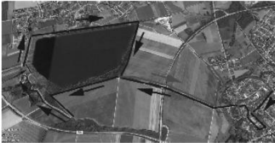
Laufstrecke Zulpich: Links Naturschutzsee, rechts der westliche Teil des Römerstädtchens.

wird. Der Eulenberg bildet ein nickliges Hindernis nach gut 3 Kilometern Laufstrecke. Nach ca. 300 m ständigem Aufstiegs wird so mancher gehörig aus der Puste gekommen sein. Doch sofort nach dem Aufstieg erwartet das Feld ein steiles und recht kurvigtes Bergabstück, das durch ein kleines, verwunschenes Waldstück, zwischen Pferdekoppel und Landwirtschaftshof direkt wieder zum Uferpfad des Baggersees führt. Nach der Umrundung des ruhigen Gewässers geht es wieder stadteinwärts. Mit einigen kleinen Richtungsänderungen wird nach ca. 2,5 km das Köln-Tor und die Innenstadt wie bereits am Anfang des Rennens durchlaufen und endet schließlich am, extra für die Landesgartenschau 2014 neu gestalteten, Marktplatz, der dem Zuschauer einen weitläufigen Blick in die Eifel über den Naturschutzsee hinaus anbietet.