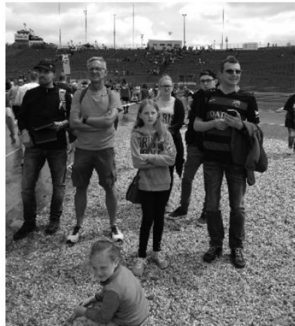
„Wo laufen Sie denn“: Die Bleifuß - Begleitmannschaft auf der Suche nach ihren Athletinnen und Athleten

runden Gesellen und wurde erst nach Rennende bei den Aufräumarbeiten gerettet.