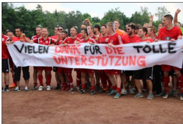
Aufsteiger 2016 - TuS Mechernich 1. und 2. Mannschaft