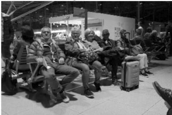
Früh unterwegs: Bleifüße am Flughafen Köln-Bonn

10 Nachzügler machten sich am 14.10.2016, einem Freitag, bereits um 3.00 Uhr auf die Reise. Aufgesammelt von einem vorbestellten „Sammeltaxi“ machte man sich auf den Weg zum Konrad-Adenauer-Flughafen Köln-Bonn, um den frühen Flug von Air Berlin um 5:45 auf die Baleareninsel zu wagen.