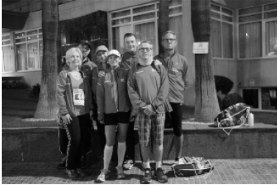
7.30 ab Can Pastilla: Marathonis und auch halbe beim obligatorischen Fototermin vor dem Hotel

Nach dem Abendessen noch einen kurzen Spaziergang, das waren wir ja schon gewohnt und dann ab in die Federn, denn für den Sonntag waren sportliche Erfolge fest geplant.