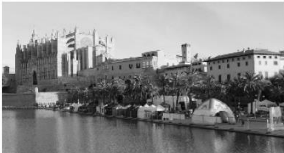
Früh am Tag: Die Marathonmesse vor der Kathedrale

Geschäfte, Märkte, Restaurants und Cafés auf der gesamten Wegstrecke der Promenade entlang der Strandlokale lassen das Gefühl von Einsamkeit erst gar nicht aufkommen. Wer es ruhiger möchte, sollte sich also am nördlichen Teil der Promenade in Can Pastilla stationieren.