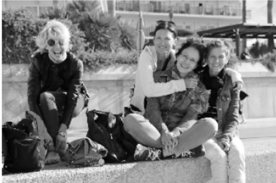
11.00 Uhr Palma: Es wird Zeit für die Shopping Queens

Die Shopping-Queens selbst nahmen selbstverständlich ein richtiges Taxi. Denn, eine Bushaltestelle zu finden, deren Existenz man nur vom Hörensagen kennt, ist schließlich ein zu großes Belastungsrisiko. Und da Taxis auf Mallorca bezahlbar sind ... ☺.