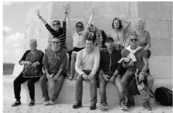
Verschnaufpause: Nur noch eine Stunde bis Palma ...

Mallorca bietet für eine Wanderung zwischen Can Pastilla und der Kathedrale in Palma de Mallorca - dort fand zwischen Kathedrale und Hafen die Marathonmesse statt - absolut ideale Bedingungen. Die Wegstrecke ist bis Palma super ausgebaut und nur von Fußgängern und Radfahrern! bevölkert. Das Meer ist immer im Blick. Erfrischende Spritzer, bei halbsteifer Brise, von Wellen, die gegen vorgebaute Steinwälle wappen und Spritzer von oben, aus zwischenzeitlich dunklen Wolken mit glücklicherweise nur geringer Regenneigung, ließen die kurze Strecke wesentlich länger erscheinen. Und erst die Abkürzungen. Wir umrundeten ganz locker ein Quadrat von ca. 800 m Länge, um zu erkennen: Das war keine Abkürzung. Wir wären vor 10 Minuten besser mal rechts abgelenkt.