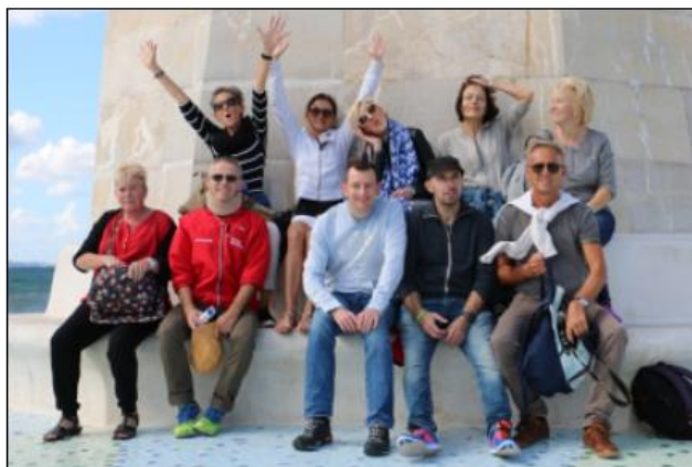
TuS Bleifuß Mechernich auf Mallorca