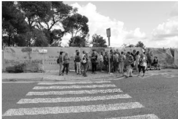
Busstop nach Palma: Aber kein Bus hält

Hier steht erreichbar, nicht erreicht! Denn nach dem sechsten Bus, der total überfüllt, ohne anzuhalten, einfach vorbeifuhr, entschloss man sich, die kurze Wegstrecke zu Fuß in Angriff zu nehmen. Wir sind ja auch eine Laufgruppe und keine Fahrgemeinschaft. Also los!