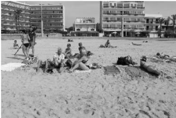
Strandleben: Sonne tanken, denn am Abend geht's zurück

Nachbarschaft. Doch irgendwann war die Party vorbei und der nächste Morgen graute.