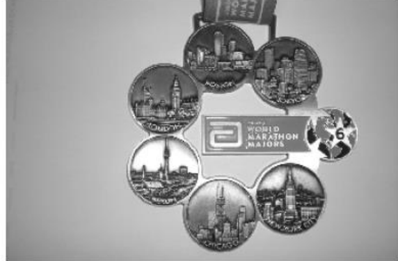
Objekt seines Traums: Marathon Major Medaille als Beweis, dass der Traum Realität geworden ist

Sein absoluter Höhepunkt sollte aber kurze Zeit später folgen. Der Lohn für die Mühen der großen Serie: Die Ausgabe der Marathon Major Medaille als Ausdruck der läuferischen Leidenschaft unseres weltreisenden Bleifußmarathonläufers und als Ergebnis seines Traumes: Die 6 größten Marathons dieser Welt gelaufen zu sein.