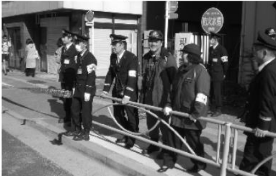
Strenge Kontrolle: Ordnungs- und Räumdienste entlang der gesamten Strecke

Er ließ sich Zeit, viel Zeit. Eile, wie in früheren Jahren, hatte er sich für den Lauf auf japanischem Boden unter sagt. Sichtlich genoss er die Atmosphäre des Laufes, die fremde, faszinierende Architektur, die erdbebensicheren Hochhausschluchten und die unglaubliche Geduld und Freundlichkeit der japanischen Gastgeber. Und: Sauberkeit war oberstes Gebot. Jeder Becher, jede Verpackung wurde sofort Beute einer der unzählig vielen Streckenposten, die wohl für diesen einen Tag als größtes Abfallbeseitigungssystem der Welt bezeichnet werden könnten. Nicht wie sonst bei Großveranstaltungen dieser Art absolute Notwendigkeit, wird hier dem Abfallräumdienst nach dem Ende keine große Bedeutung mehr beimessen sein. Schier unglaublich!