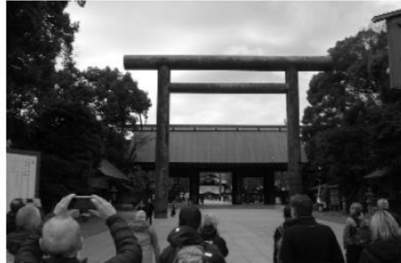
Kultstätten Tokios: Eingang zur Asakusa-Kannon-Tempel-Anlage

Filme und Bilder aus den U-Bahnstationen in Japan zeigen chaotische Zustände. Das uniformierte Personal schiebt die Menschenmassen zusammen, um die Türen des unterirdischen Fahrsystems schließen zu können. Ist man einmal drin, ist nur noch atmen möglich. Alle sonstigen Versuche, Hände oder gar Arme und Beine zu bewegen, sind sinnlos. Man kann nur warten und hoffen, dass sich dies an der nächsten Station ein wenig entspannt.