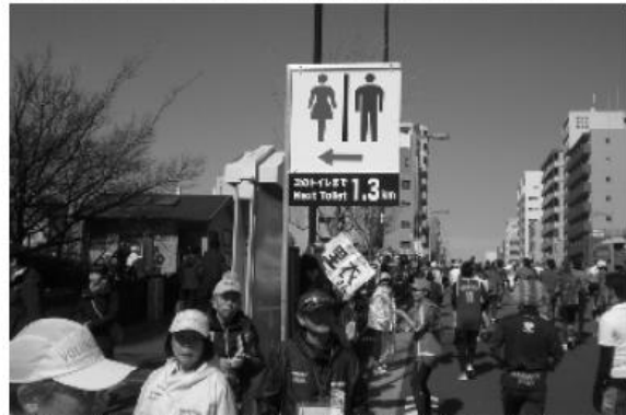
Weiße Wege: Nächste Toilette in 1,3 km abseits der Strecke

Für die Teilnehmerinnen und Teilnehmer ein Problem sind allerdings die versteckten Toiletten, die teils nur über lange Umwege zu erreichen sind. Hier hat die Sauberkeit ihren Preis. Aber unseren Teilnehmer konnte das an diesem Tag nicht erschrecken. Der Genuss und das unendliche Gänsehautfeeling vom Anfang bis zum Ende ließ negative Gedanken erst gar nicht aufkommen.