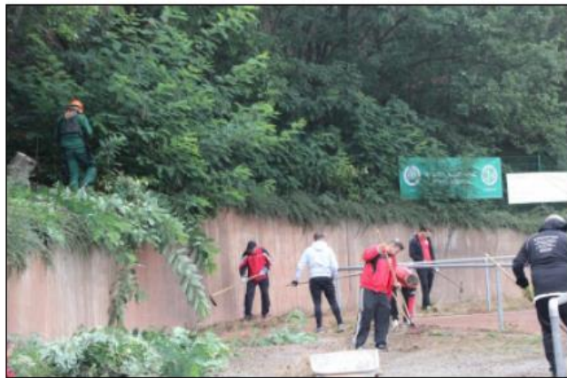
Fußballseniorenabteilung - Sauberer Sportplatz 2017