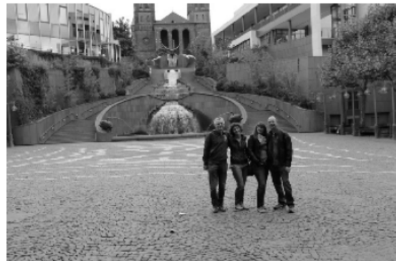
Bitte nicht zu schnell: Bleiße auf dem Schloßplatz in der Fußgängerzone von „Bärnesens“

Der Ortsteil Sommerwald auf einem der 7 Hügel gelegen, auf denen die Stadt Pirmasens aufgebaut worden ist, führt die Läufer-schar zum großen Teil über asphaltierte Strecken, aber immer wieder unterbrochen durch kleine Feld-, Wald- und Wiesenstrecken an Pferdekoppeln vorbei, Richtung Ziel, den Messehallen in Pirmasens.