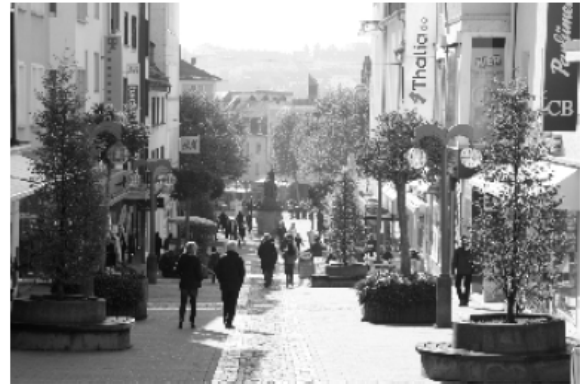
7-Hügel-Stadt: Pirmasenser Fußgängerzone mit Blick auf weitere Stadtteile

an dem sinnigerweise der Polizeisportverein sein Domizil besitzt, zum Beckenhof, einem Naherholungsgebiet, das an allen Sommerabenden und vor allem an den Wochenenden hoffnungslos überfüllt ist. Die Gastronomie bewirbt dort mit bürgerlicher Küche und pfälzischen Gaumenfreuden.