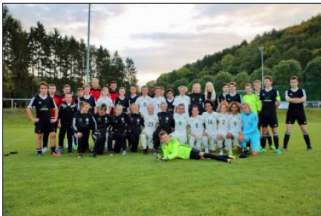
C1-Junioren empfang U15-Juniorinnen-Nationalteam