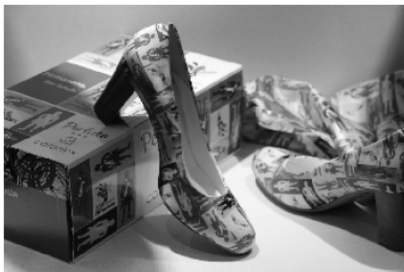
Vergangene Zeiten: Pirmasens galt lange Zeit als deutsche Schuhmetropole (Aufnahme aus dem städtischen Museum im alten Rathaus)

Der Weg führt die Läufer/innen aber nicht zur nächsten Weinprobe. Nein, vielmehr geht es 2 Kilometer weit wieder in Richtung Westen, bevor der dicht bewaldete und zu Spaziergängen einladende Waldfriedhof gestreift wird. Vorbei an der östlichen Flanke wird es beschwerlich. Mit einem Belag aus Sand und Gras beginnt ein langer Einstieg in die Höhe, bevor ein festgetretener Waldbodenbelag, durchzogen mit kleinen Pfützen aus den Regentagen zuvor, ein weiteres steileres Stück markiert.