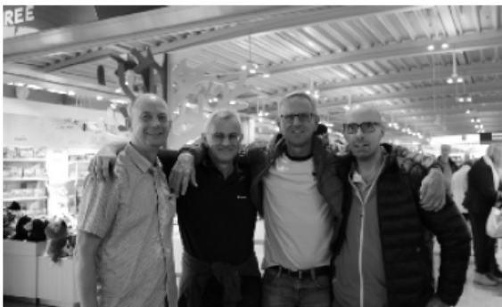
Zusammengerauft: Auch die Herren durften mitfliegen

Genau das taten wir am Freitag, dem 13. Oktober 2017, nicht. Denn genau an diesem Datum hatten wir nämlich den Start für unsere Reise zum diesjährigen Rock'n Roll Marathon in Lissabon geplant, der am folgenden Sonntag stattfinden sollte. Und das Wetter war uns hold.