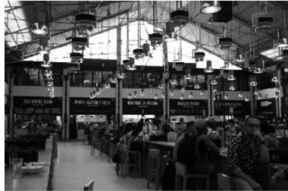
Zeit zum Essen: TimeOut Market in Lissabon

le war Voraussetzung, um die Essensaufnahme nicht stehend genießen zu müssen. Anders als derzeit beim FC war unsere Abwehr nicht zu überwinden. Und das Essen war köstlich.