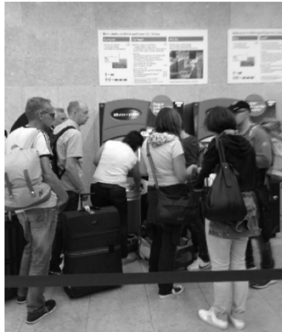
Automatenspiele: Bleifüße mit Problemen bei der Fahrkartenausgabe