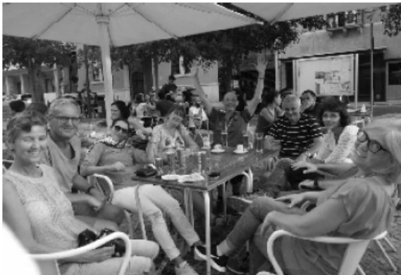
After Run Party: Bleifüße genießen Lissabon

Gewöhnungsbedürftig für uns Nordländer, aber verständlich aufgrund der klimatischen Bedingungen sind die Servicezeiten, die uns zu einem Zwischenaufenthalt an einer kleinen Außenlokation zwang. Und auch da erlebten wir eine Überraschung. Die Preise für Getränke waren so niedrig, dass wir zweimal ungläubig die Frage nach der Richtigkeit der Rechnung gestellt haben.