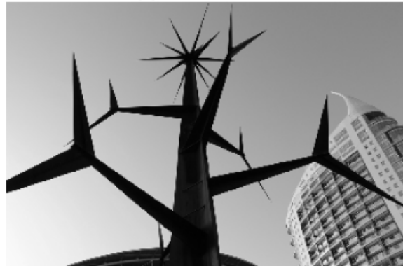
Auf dem Weg zur Expo: Kunst vor dem Weltausstellungsgelände des Jahres 1998 in Lissabon

Das Fahrkartenproblem war noch vorhanden, aber wir konnten jetzt damit umgehen. Nur den Zugang zum Bahnsteig mussten wir noch üben. Und benötigten dabei immer wieder mal fremde, freundliche Hilfestellung, die uns auf unsere Fehler aufmerksam machten und uns unsere Beförderung garantierten.