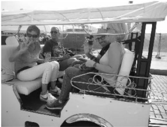
Auf dem Weg zur Altstadt: Tuck Tuck fahren macht sichtlich Spaß

Wir waren alle müde. Also fiel die Entscheidung, im Hotel zu verbleiben und dort unser Abendessen zu genießen. Eine Fehlentscheidung, wie sich herausstellen sollte. Es ist uns schon aufgefallen, dass wir die einzigen Gäste waren. Und wie bald vermutet, waren nicht alle mit ihrem Essen einverstanden. Das sollte uns am nächsten Tag nicht wieder passieren. Das Hotel wurde fortan nur zur Übernachtung „missbraucht“. Aber die war dann auch ok. Und das Frühstück war es auch.