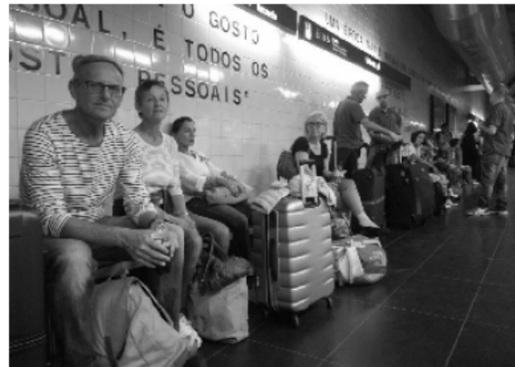
Alles am Griff: Der Rucksack ist auch dabei

Auch die Teile aus Mechernich lugten nach und nach aus der kleinen „überkofferbreiten“ Öffnung, die den Durchgang für die heiße Ware aus Köln bildete.