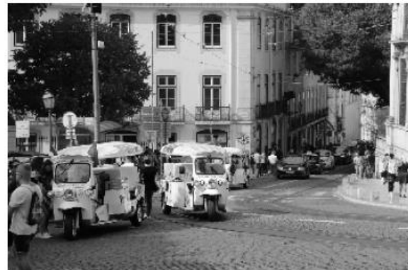
Flottenverband: Tuck Tucks bieten ihre Dienste an

Der Samstag sparte nicht mit Sonnenschein und richtig hohen Temperaturen. Für Sightseeing ein Genuss, aber nicht im Bus. Den haben wir uns dann auch erspart. Wir wählten zwei Exemplare aus der „TUCK TUCK Familie“. Mit dieser Entscheidung lagen wir goldrichtig. Durch die engen Gassen der florierenden Altstadt mit Aussichtspunkten über die ganze Stadt kommt man nur mit diesen Fahrzeugen. Ein Doppeldeckerbus ist dort nie gesehen worden. Er hätte auch in den engen Kurven und den nahe beieinander stehenden Gebäuden keine Chance eines Durchkommens.