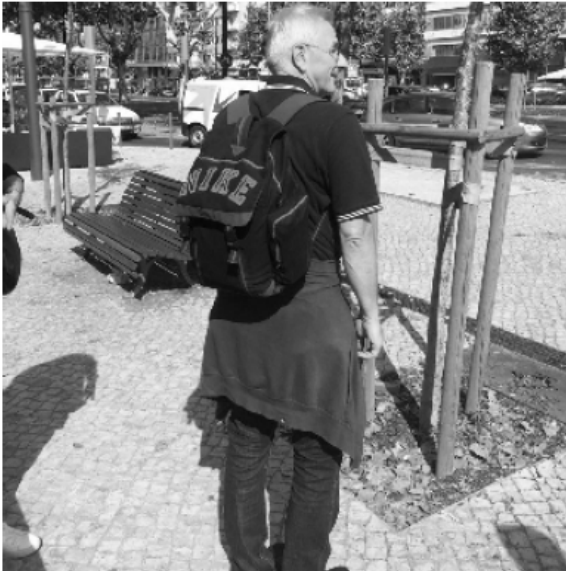
Beleidigt: ... und einfach sitzengeblieben. Der Rucksack

so bleib ich sitzen und suche mir ein schönes Plätzchen zum Verweilen“, dachte er sich wohl. Schließlich hatte er ja alles, was für den Aufenthalt in südlichen Gefilden notwendig war: Geld, Kreditkarten, Ausweise, Hotel-Voucher, Fotoapparat, Führerschein, Gesundheitskarte, Autoschlüssel, Fahrzeugpapiere. Schlicht alles, womit die Reise und nicht zu vergessen auch die Rückreise gesichert schien.