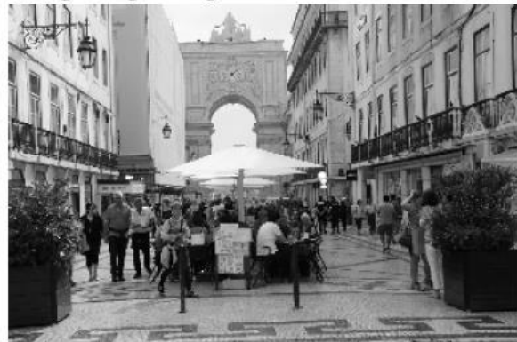
TimeOut beim Shopping: Einkaufsmeile Lissabon

Die Eindrücke des Tages machten müde. Der Abendspaziergang um das Hotel war obligatorisch. Der Supermarkt um die Ecke deckte unseren Bedarf an weiterem Essen und vor allem Getränken. Schließlich stand am nächsten Tag der eigentliche Sinn unserer Reise auf dem Programm: Marathon und Halbmarathon im Süden Portugals. Sightseeing zu Fuß.