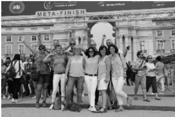
Im Ziel: Die Bleifußgruppe hat ihr Ziel in Lissabon erreicht

stadt“ fort. Und sie führte uns zum TimeOut Market , einer Mischung aus Großhandelsmarkt und Restaurantmeile, gespickt mit einer Vielzahl an Essensangeboten, die wir auch im weiteren Verlauf des Nachmittags gerne nutzten.