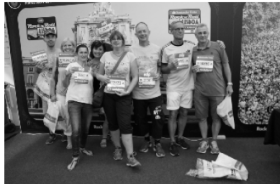
Fotosession mit Bleifuß: Halb- und Ganz-Marathonis in vorbildlicher Haltung

Erste Station unserer Erkundungsreise war das ehemalige Expogelände der Weltausstellung des Jahres 1998 in Lissabon. Futuristische Gebäude, große Einkaufszentren und schließlich die Seilbahn über dem Gelände wiesen uns den Weg. Die Marathonmesse selbst war überschaubar. Der Andrang erstaunlicherweise ebenso. Und wie sonst auch üblich klapperten wir viele Stände ab. Getränke aller Arten wurden angeboten, Laufartikel satt und kostenlose Fotos vor touristischen Hintergründen konnten von den sportlichen Models, u.a. zehn aus Mechernich, in allen Posen aufgenommen und verteilt werden.