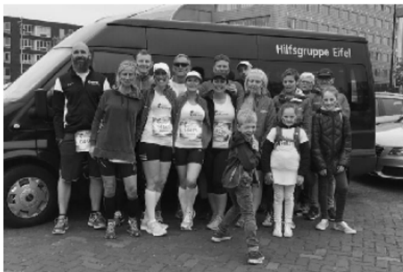
Reisen unter Freunden: Benefizlauf in Breda mit den Bleifüßen

Auch wir anderen waren nicht untätig. So ging es zum Benefizlauf nach Breda. Gelaufen wurde nach dem Prinzip: Viele Kilometer, viele Spendengelder. Und die Bleifüße waren trotz schlechter Witterung zahlreich vertreten.