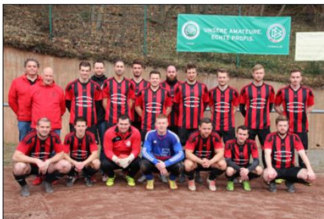
Neue Trikots für die 2. Mannschaft von der BLW