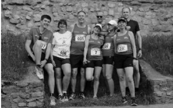
BleifüÙe vor historischer Kulisse: Die „Chlodwiggruppe“ der BleifüÙe vor dem Start im Römerstädtchen

Hoch motivierte Läuferinnen und Läufer aller Altersklassen erlebt man hautnah bei ihren Wettkämpfen durch die Innenstadt. Eltern feuern ihre Kinder und Kinder ihre Eltern an. Jung und Alt kämpfen in unterschiedlichen Wettbewerben um den Sieg, der oftmals alleine darin besteht, die geforderte Strecke in Angriff zu nehmen und zu beenden.