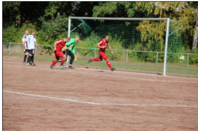
1. Mannschaft - großer Jubel - der Siegtreffer