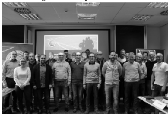
Teilnehmer und Verbandsvertreter bei der 3. Dialogwerkstatt Spielbetrieb in Hennef

Im dritten Jahr in Folge fand am 19.01. in Hennef die "Dialogwerkstatt Spielbetrieb" statt zu welcher der Fußball-Verband Mittelrhein alle Vertreter der auf Verbandsebene spielenden Vereine eingeladen hatte.