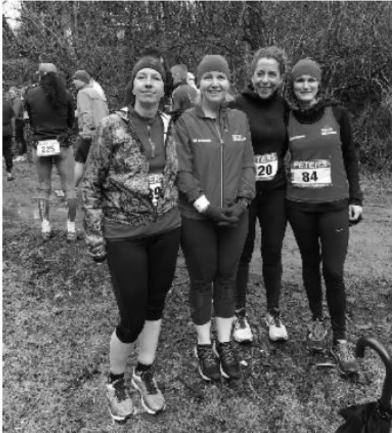
Mutig: Lächeln im Kampf gegen das Sturmtief

Wie Puderzucker bedeckten Schnee und Eis die Mon- schauer Extremlaufstrecke in den letzten Jahren. Wer seine Spikes zu Hause vergaß, konnte die vielen eisbe- deckten Flächen nur ganz vorsichtig in kleinen Schritten oder gar nur rutschend überwinden.