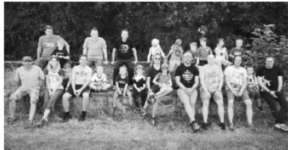
Unser zukünftiges F2 - Team