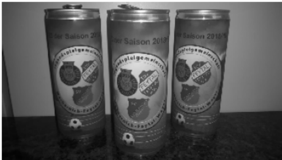
Der neue JSG Mechernich-Feytal-Weyer Zaubertrank

Auf dem Sportplatz in Vussem, wo stets montags und mittwochs ab 17 Uhr fleißig trainiert wird, stand dieses Mal nur eine kurze Einheit auf dem Programm, denn die Trainer Nico Schmitz und Thorsten Schmidt hatten den Fokus auf ein gemeinsames Abendessen gelegt. Damit trafen die Trainer genau den Geschmack der Jungs und das im wahrsten Sinne des Wortes. Ratzfatz machte sich die Mannschaft über die Pizzastücke her und dazu gönnte man sich den ersten isotonischen JSG Mechernich-Feytal-Weyer - Zaubertrank, der für die gute Ausdauer und das Durchhaltevermögen auch in der kommenden Spielzeit sorgen soll. ;-)