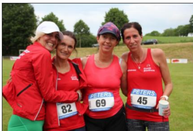
TuS-Bleifuß Läuferinnen bei „Rund um Köchel“