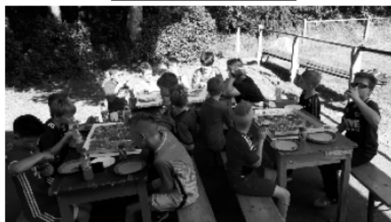
Die hungrige Meute der E3 beim Pizzessen

Unsere E3-Junioren ließen es sich bei sommerlichen Temperaturen am 19. Juni einmal gut gehen, denn zum Abschluss der Saison wurde die Mannschaftskasse