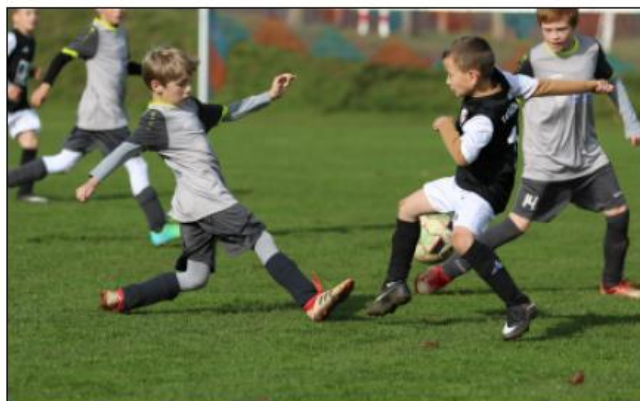
E1-Junioren beim Sieg gegen Zülpich IV