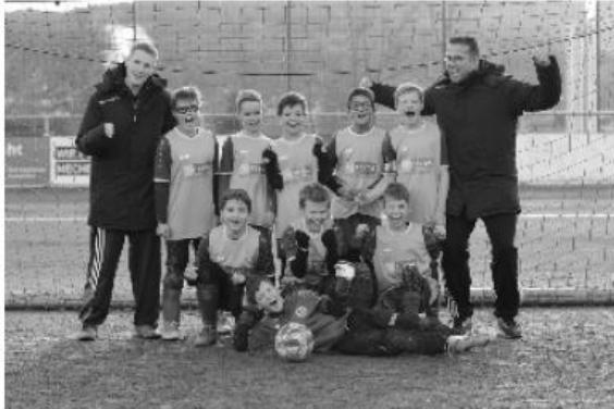
Ein Teil der E1 nach dem Gewinn der Herbststaffel

E1-Junioren werden Sieger ihrer Herbststaffel Bericht und Fotos von Rocco Bartsch