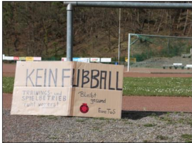
Sportplatz bis auf Weiters gesperrt