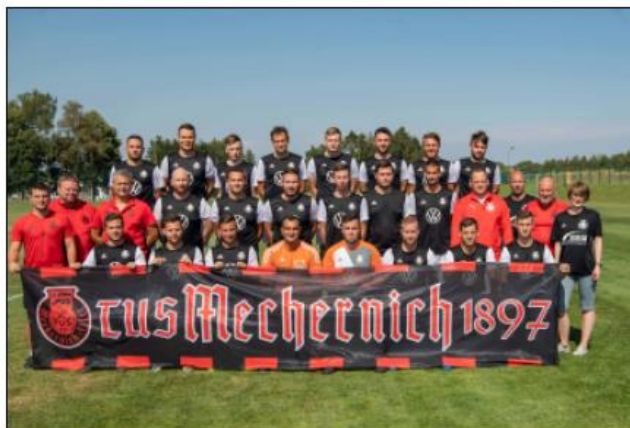
1. Mannschaft TuS Mechernich 2020/2021